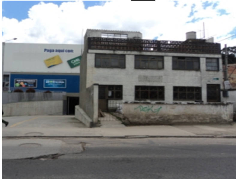
Foto 1. Predio donde antiguamente operaba el establecimiento MONTALLANTAS VULCANIZADORA LANCHEROS. KR 91 No 135BIS- 56 (Nomenclatura Actual)